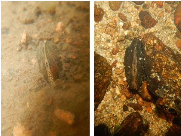
Muscheln in ihrem natürlichen Habitat (links: Bachmuschel; rechts: Flussperlmuschel)

Heimische Großmuscheln, allen voran die streng geschützten Arten Flussperlmuschel ( Margaritifera margaritifera ) und Bachmuschel ( Unio crassus ) stehen im Fokus vieler Schutzbemühungen. Auf Basis aktueller Monitoringergebnisse zum Zustand und der Gefährdung der Populationen in Bayern sollen im Rahmen der diesjährigen Tagung der Status quo und zukünftige Perspektiven des Muschelschutzes in Bayern diskutiert werden. Dabei werden u.a. folgende Fragen adressiert: Wie haben sich Bestandssituation und Gefährdungsfaktoren gegenüber früheren Erhebungen verändert? Welche Rolle spielt der Klimawandel? Welche Anpassungen bei den Zielen und Maßnahmen im Muschelschutz sind erforderlich? Neben Fachvorträgen ist auch eine Podiumsdiskussion mit Beiträgen aus dem Auditorium geplant.