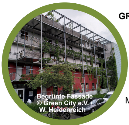
Begrünte Fassade

Nicht jede Begrünung hat einen hohen ökologischen Nutzen im Sinne von Biodiversität, Klimaschutz oder Klimaanpassung. Unternehmen fehlt meist die notwendige Expertise, um ökologisch wertvolle grüne Infrastruktur zu planen. Umweltverbände und sonstige zivilgesellschaftliche Organisationen bieten Beratung zum Thema Planung und Umsetzung von Stadtgrün an und stellen somit wichtige Kooperationspartner:innen für Unternehmen dar. Ein Beispiel ist das Begrünungsbüro von Green City e.V. in München: www.greencity.de