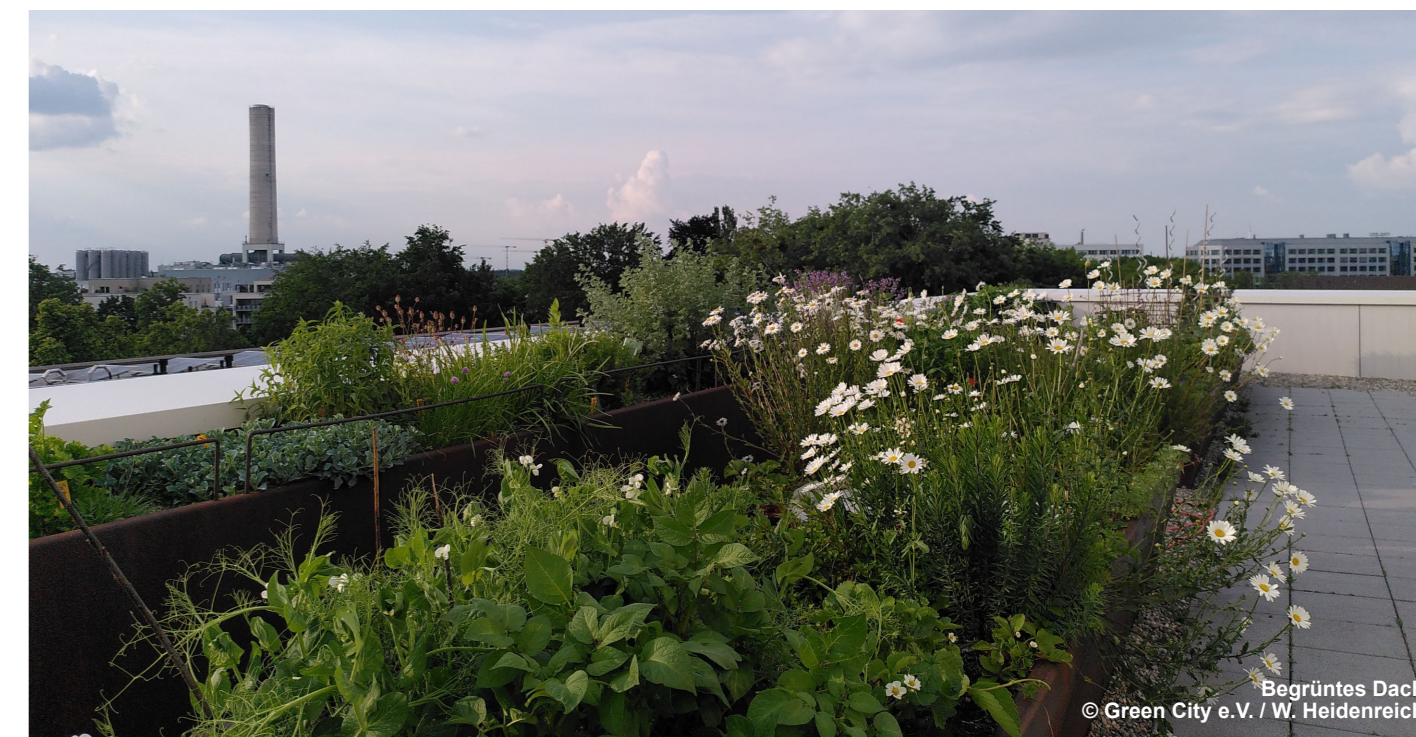
Begrüntes Dach

Der steigende Flächendruck und zunehmende klimatische Veränderungen wie Starkregen und Hitzeereignisse stellen große Anforderungen an die grüne Infrastruktur in einer wachsenden Stadt. Für eine erfolgreiche Strategie zum Erhalt und Ausbau urbanen Grüns müssen alle Akteursgruppen einer Stadt einbezogen und beteiligt werden. Unternehmen sind wichtige Akteure der Stadtgesellschaft: sie besitzen oder nutzen häufig große Flächen und Gebäude. Auch sind sie über ihre Belegschaft, Nachbar:innen und Beziehungen zu anderen Unternehmen mit ihrem Standort verbunden. Sie können durch unternehmensbezogene Grünmaßnahmen direkt einen Beitrag zur Klimaanpassung und zur Verbesserung der Aufenthaltsqualität am Standort und im Quartier leisten, sich darüber hinaus aber auch stadtweit für ein Mehr an Grün engagieren. Unternehmen profitieren dabei selbst von der erhöhten Standortqualität, die die Bindung von Mitarbeiter:innen fördert und das Unternehmensimage verbessert. In Kooperationen mit Zivilgesellschaft und Kommunen können Unternehmen wertvolle Beiträge zu grüner Infrastruktur in lebenswerten Städten leisten.