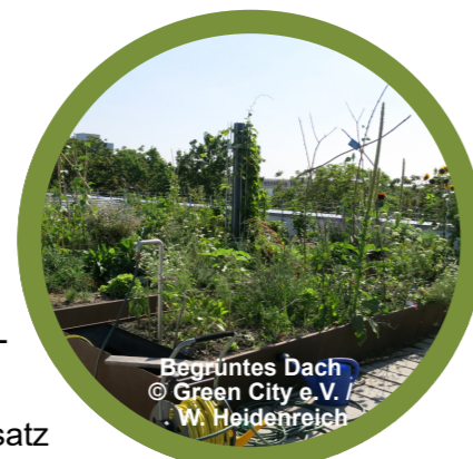
Begrüntes Dach

Wettbewerbe für attraktive Innenstädte und „City Offensiven“ können das Thema Grün vor allem beim Handel platzieren. Mehr dazu am Beispiel Cottbus: www.cottbus.ihk.de/city-offensive.de