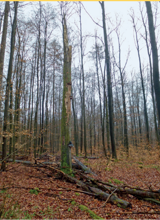
2 Ehemaliger Biotopbaum mit Pilzkonsolen und Spechthöhle im Wirtschaftswald, der nach Abbruch der Krone als stehendes Totholz geschützt wird.

fen – im Wald stehen bzw. liegen gelassen. Zudem werden Biotopbäume ausgewiesen und nicht geerntet. Eine weitere Komponente der Strategie stellte die Erweiterung von Naturwaldreservaten dar, Schutzgebieten von 25 bis 183 ha Größe, die in den 1980er Jahren eingerichtet wurden und in denen Totholz natürlich entstehen kann. Die Annahme, die der Strategie unterliegt, ist, dass die Kombination aus Schutz des bestehenden Totholzes und einer Anreicherung des Totholzhabitats im Wald die Biodiversität fördert, besonders die an Totholz gebundenen Arten. Der Effekt der Totholz-anreicherung auf die Biodiversität wurde bisher nur experimentell geprüft, jedoch noch nicht die Auswirkungen einer tatsächlich angewandten Strategie.