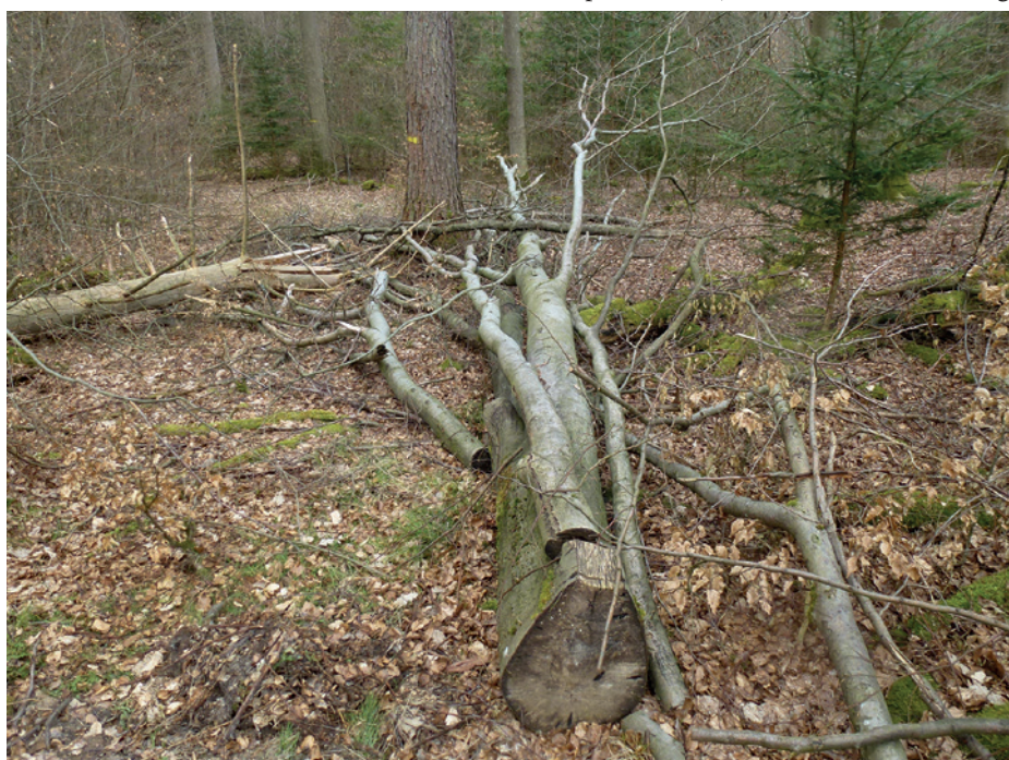
1 Beispiel für aktiv bei der Ernte im Wirtschaftswald angereichertes Totholz. Der untere, verfärbte Teil des Stammes und die Krone ab dem ersten starken Ast verbleiben im Wald. unten: Wurzelstock der gefällten Buche mit unterem Stammabschnitt, oben: Baumkrone mit starken Ästen.

Die Bayerischen Staatsforsten, die ein Drittel des Waldes in Bayern verwalten, haben im nördlichen Steigerwald seit 2006 eine solche Totholz anreicherungstrategie im Rahmen einer Naturschutzstrategie eingeführt (BaySF 2016a). Die Totholz anreicherung wird hauptsächlich dadurch erreicht, dass zum einen aktiv Baumkronen und Stamm-Endstücke, die normaler Weise verwertet würden, nach der Ernte im Wald belassen werden (Abbildung 1). Zum anderen wird natürlich entstandenes stehendes und liegendes Totholz – zum Beispiel nach Windwür-